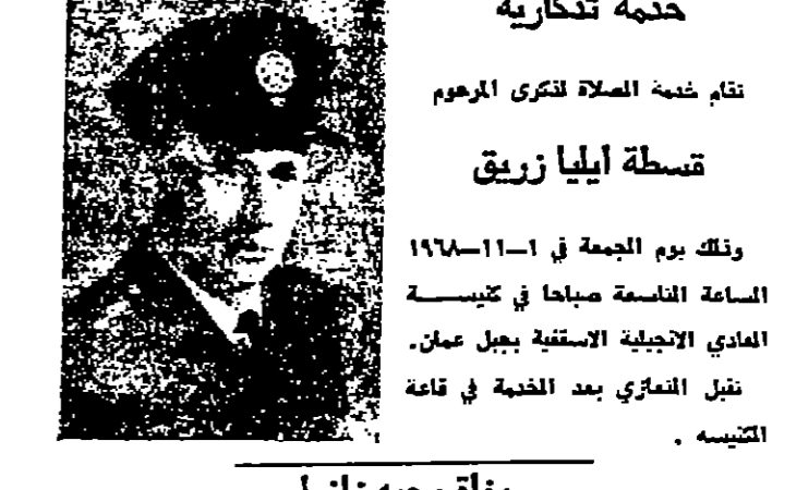
خدمة تذكرية نظام خدمة الصلاة لتكري المهوم قسطة ايليا زريق

ابو ظبي - اقلبية - قال الشيخ زايد بن سلطان حاكم مملكة ابو ظبي ان الاجماع الذي شغده حكام الامارات العربية في الاسبوع الماضي يبيّن ميخانات بناءه جدا في المسر نحو اتحاد الامارات.